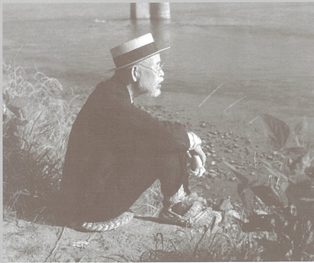
※写真：大石田の最上川のほとりにて